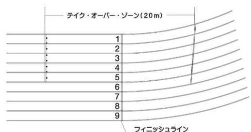
4×400mリレー 第3、第4走者のテイク・オーバー・ゾーン